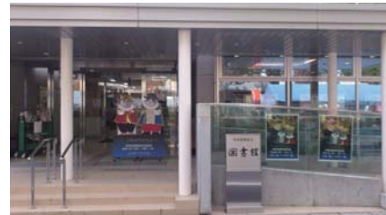
にゃびえる&にゃーりんお出迎え