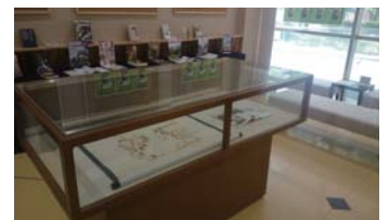
貴重な資料『石垣原合戦絵図』を展示しています