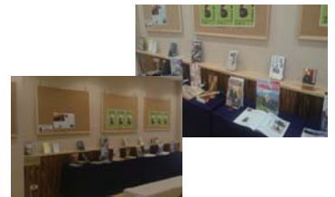
黒田官兵衛に関する図書は貸出できます